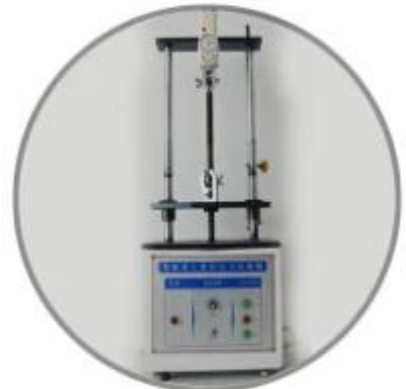
Tensile testing machine