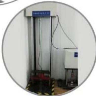
Impact Resistant Testing Machine