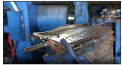
3. PVC Injection