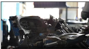
4. Open The Mould