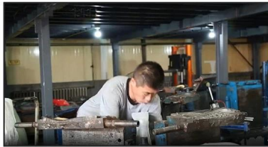
2. Putting Polyester Lining