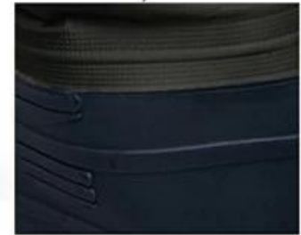
Heat Seal Technique