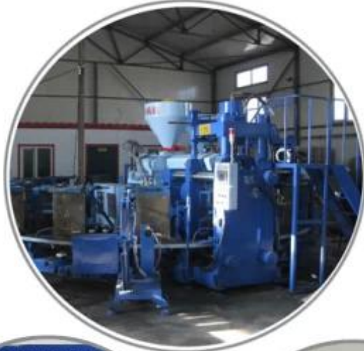
Automatic Injection Molding Machine