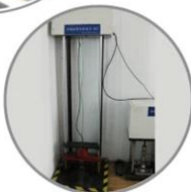
Impact Resistant Testing Machine