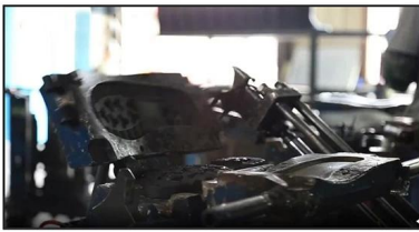
4. Open The Mould