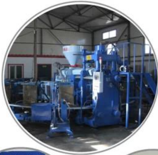
Automatic Injection Molding Machine