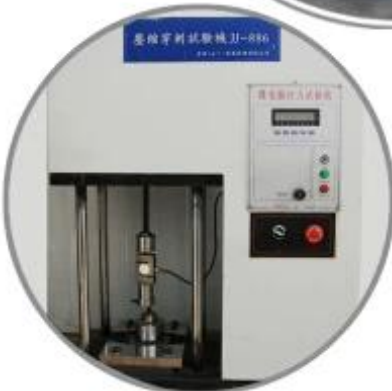
Puncture Testing Machine