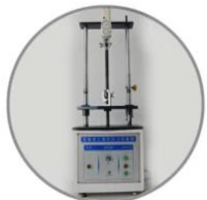
Tensile testing machine