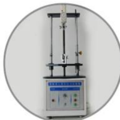
Tensile testing machine