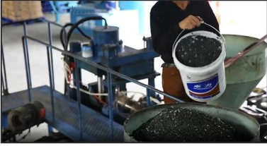
1. Mixing Materials