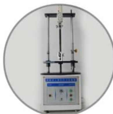
Tensile testing machine