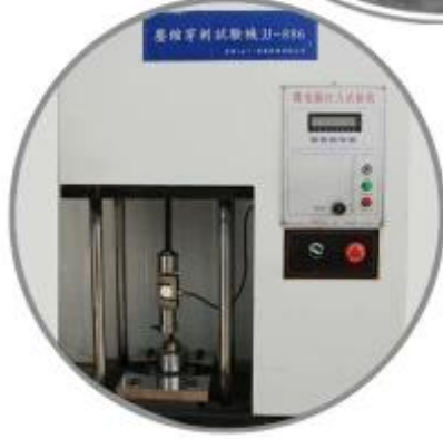
Puncture Testing Machine